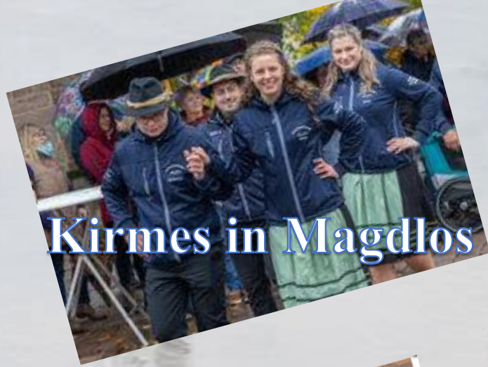
Kirmes in Magdlos