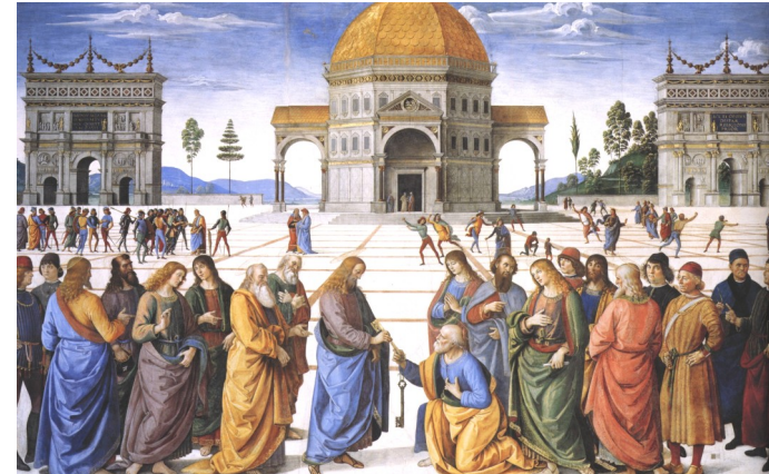
Christus übergibt Petrus den Schlüssel, Pietro Perugino 1481-82