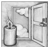
Erster Advent O Heiland, reiße die Himmel auf