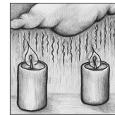
Zweiter Advent O Gott, ein' Tau vom Himmel gieß