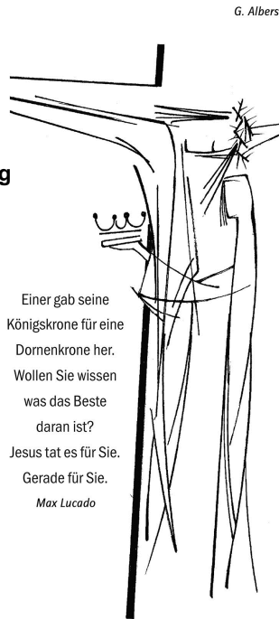
Einer gab seine Königskrone für eine Dornenkrone her. Wollen Sie wissen was das Beste daran ist? Jesus tat es für Sie. Gerade für Sie. Max Lucado