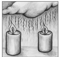
Zweiter Advent O Gott, ein' Tau vom Himmel gieß

18.30 Uhr Dekanats-Abendmesse in St. Michael