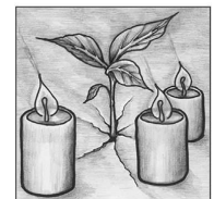
Dritter Advent O Erd, schlag aus, schlag aus, o Erd