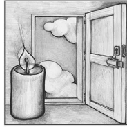
Erster Advent O Heiland, reiße die Himmel auf