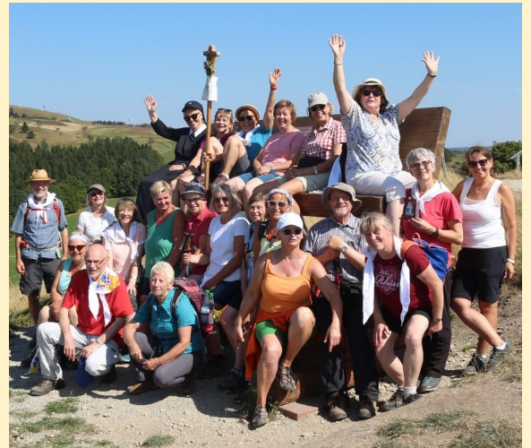
Pilgern in der Rhön