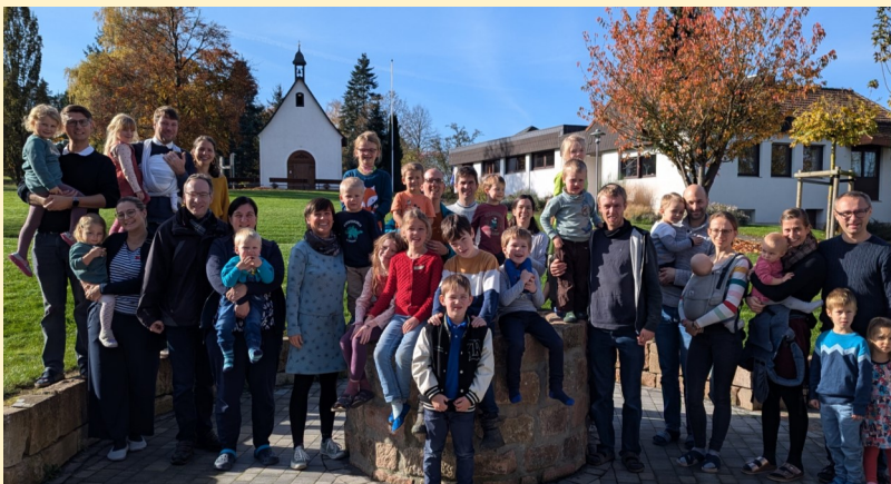
Ehe-Vorbereitungskurs 2016 / Nachtreffen 2024

„Zuversicht schöpfen aus dem Brunnen deiner Liebe, Kraft schöpfen aus dem Gnadenquell im Heiligum, lebendiges Wasser trinken ... dazu sind wir eingeladen...“ Dr. Vonderau