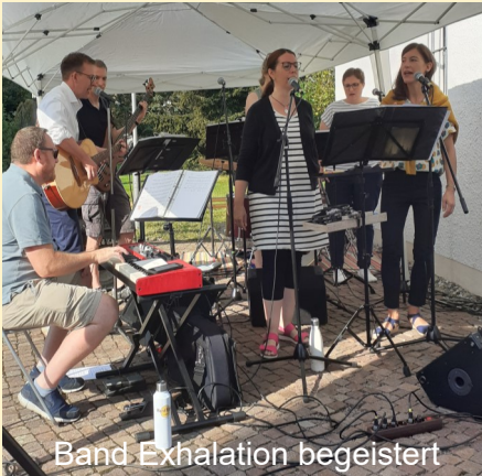
Band Exhalation begeistert